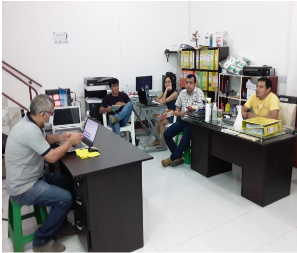
Jaén: 20/06/2020, Capacitación en Trazabilidad del Café a equipo técnico, administrativo y contable de la Organización La Gran Reserva.