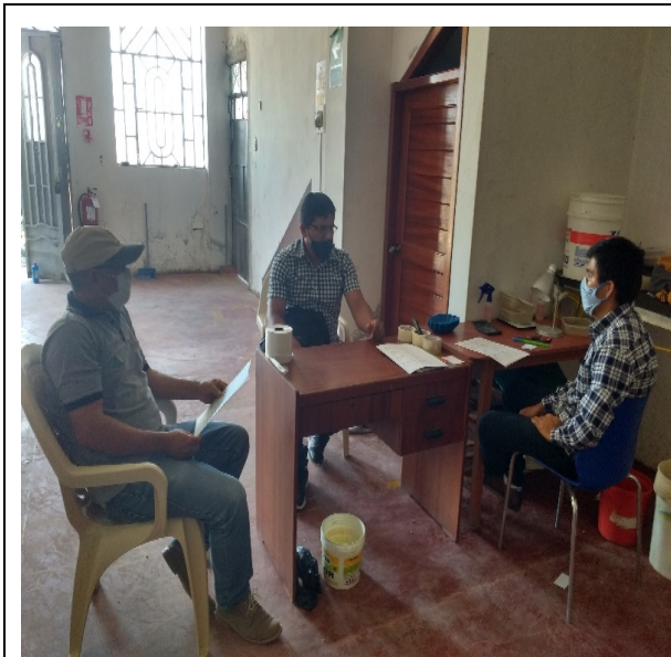
Jaén: 12/06/2020, Pre auditoria SIC Cooperativa COOPVAMA