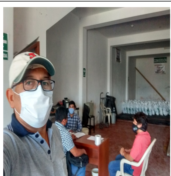
Jaén: 12/06/2020, Pre auditoria SIC Cooperativa COOPVAMA