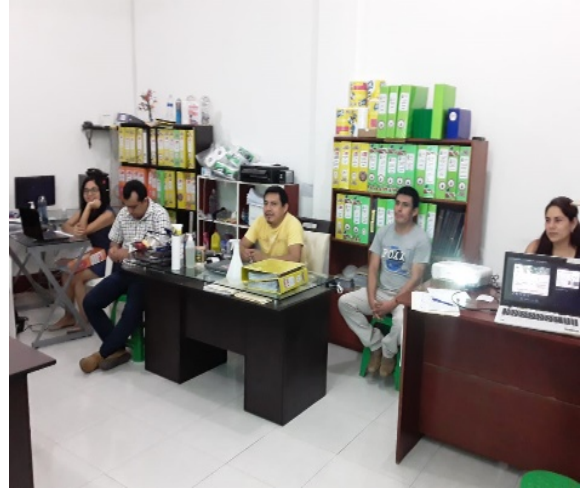
Jaén: 20/06/2020, Capacitación en Trazabilidad del Café a equipo técnico, administrativo y contable de la Organización La Gran Reserva.