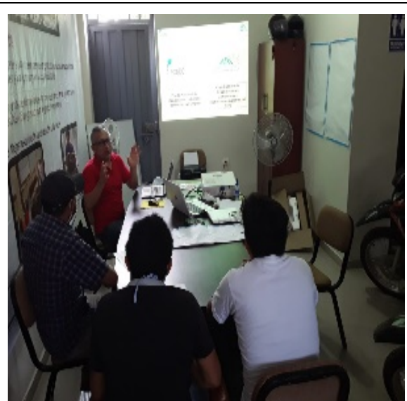
Jaén: 15/06/2020, Capacitación a beneficiarios del sector distrito de Bellavista - Sector El Limón, en Cosecha Selectiva y Manejo de Despulpadoras, Socios de ECOFOREST