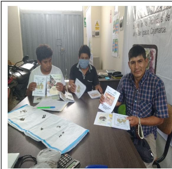
Jaén: 15/06/2020, Capacitación a beneficiarios del sector distrito de Bellavista - Sector El Limón, en Cosecha Selectiva y Manejo de Despulpadoras, Socios de ECOFOREST